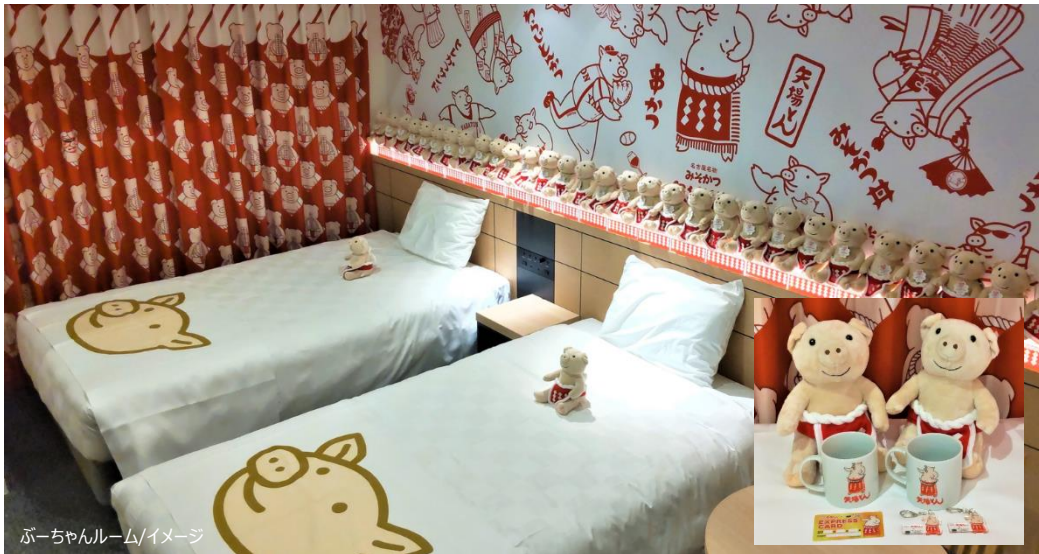
ぶーちゃんルーム/イメージ

H.I.S.ホテルホールディングス株式会社（本社：東京都港区）が運営する「変なホテルエクスプレス名古屋 伏見駅前」は、名古屋名物みそかつの「矢場とん」の夕食付で、イメージキャラクター「ぶーちゃん」で客室を飾った「ぶーちゃんルーム」を本日7月21日（金）より発売、7月22日（土）より宿泊提供を開始いたします。